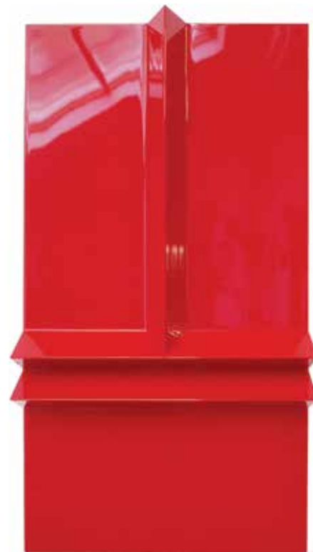
Nase und Lippen , 2022

Holz, original Ferrari-Lack, 49 × 25.5 × 5 cm