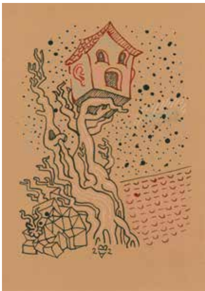
Baumhauskopf , 2022