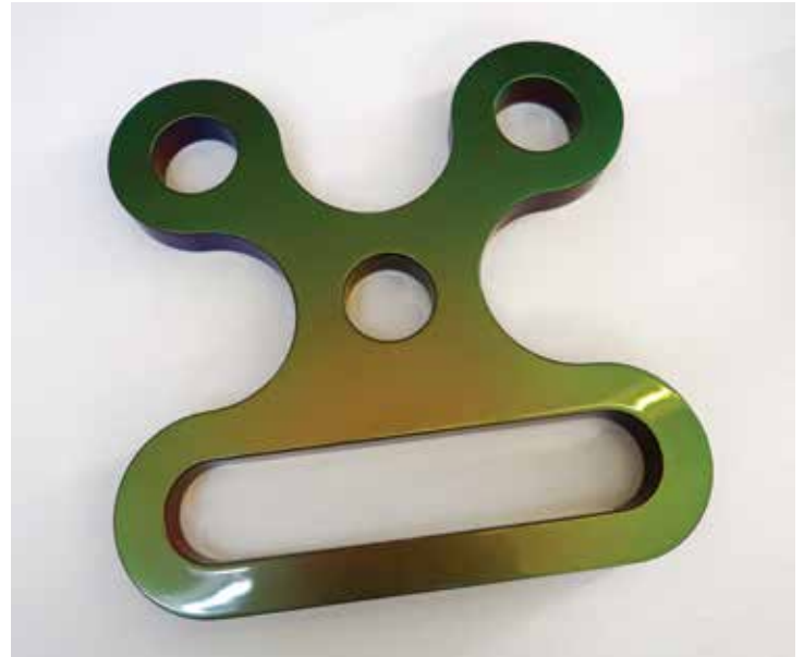
Röhrenkopf 2, 2022

MDF, Lackfarbe changierend grün – blau, 30 x 30 x 2.5 cm